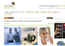
Culture et nutrition 8 avril