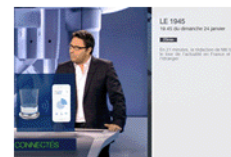
M6 19h45 24 janvier