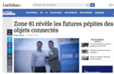
Les echos.fr 31 mars