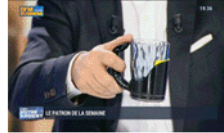
BFM tv 1er mai